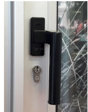
Ej. Cierre - Manija Cierre 9434-0 Manija Acodada Alcemar 9444-3