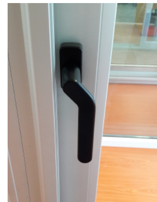
Ej. Cierre - Manija Cierre 9432-0 Manija Acodada Modelo SR 9440-5